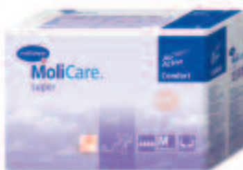
MoliCare Comfort super