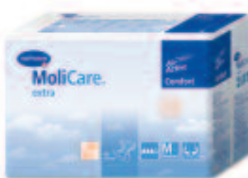
MoliCare Comfort extra